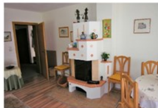
Ein Kachelofen im Wohnzimmer sorgt für Gemütlichkeit.

In absolut sonniger Lage von Oetz befindet sich diese 3-Zimmer-Wohnung mit ca. 88,31 m 2 . Ein Balkon, Kellerabteil und eine Garage sind integrierender Bestandteil der Liegenschaft. Mehr Infos: www.immobilien-rueck.at Ihr direkter Draht zur Immobilie: Tel. 0699-11133322, Hubert Rück. WERBUNG